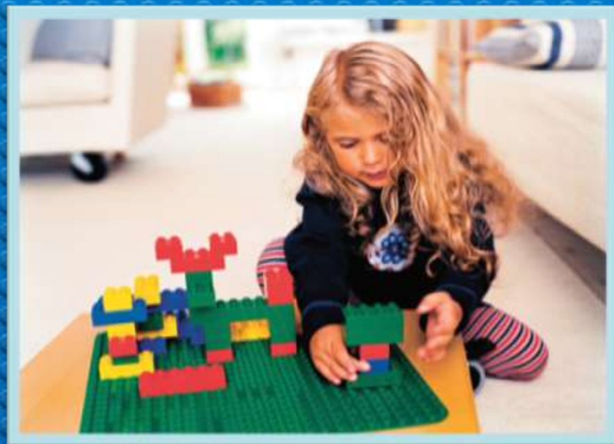
Гигантский набор Дупло